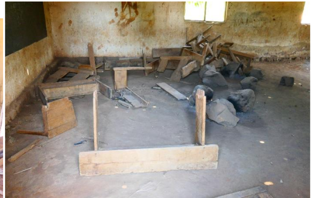
Hier wurde ein Schulraum aufgegeben und als Holzlager missbraucht-

Bei einigen Volksgruppen wird die Schulbildung von Mädchen (über Lesen, Schreiben und Rechnen hinaus) als nicht notwendig angesehen und ihnen eine weiterführende Schulbildung verwehrt.